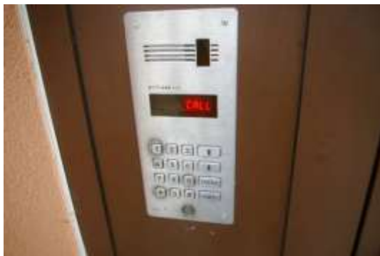
Būve ar kadastra apzīmējumu 1700 014 0166 001