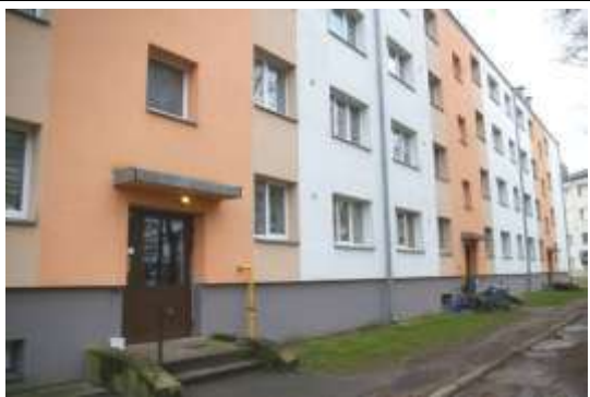
Būve ar kadastra apzīmējumu 1700 014 0166 001