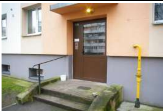
Būve ar kadastra apzīmējumu 1700 014 0166 001